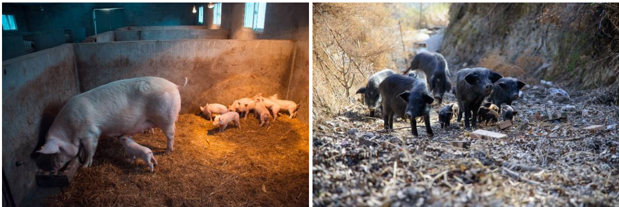
元気に生まれた子豚たちと、チベットの黒豚（ガンブ村）

アグロフォレストリーシステムがコミュニティにもたらす収入は徐々に増えており、1年から2年で費用をまかなうことができる予定です。3月には、豚が出産しました。生まれた子豚たちは、半年で販売できるようになります。さくらんぼの花が咲き始め、まもなく実をつけるようになります。