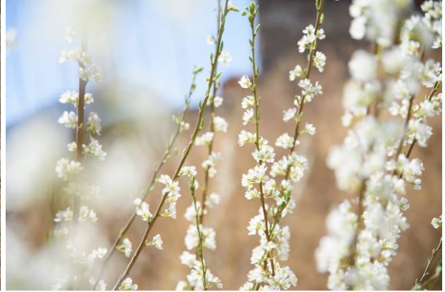
ガンブ村の桜