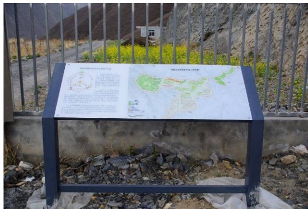
プロジェクトを紹介する看板を設置