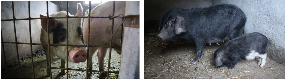
成長した大人の豚とチベットの黒豚（ガンブ村）

チベットの黒豚はこれまでに 56 頭を出産しました。今年の夏には販売できるようになります。それとは別に、家畜用の豚の子豚 35 頭を飼育し、販売し、約 10 万中国元の収入を得ました。成長した豚を購入したのは地元の住民で、新年のご馳走にエコフレンドリーな豚肉でベーコンを作るためでした。得られた収入は来年用の資金となります。