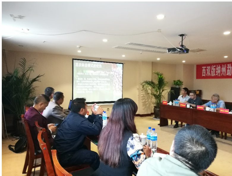
Xishuangbanna 自然保護区のプロジェクト開始会合

10月中旬、Xishuangbanna 自然保護区内のアグロフォレストリープロジェクト開始の会合が、雲南省のモウ海県で開催されました。アグロフォレストリーと内容とプロジェクト地域の基本的な情報が説明され、実施計画が提示されました。Xishuangbanna 熱帯雨林保全財団の総責任者、Xishuangbanna 自然保護区やモウ海県内の準保護区のディレクターたちとともに、副地区長、地域のリーダーたち、森林業、農業、畜産業に関わる政府関係者が参加し、支援を表明しました。Changheba 地域の代表者も参加し、会合後に現地視察の案内をしました。アグロフォレストリーづくりは、来春始まる予定です。