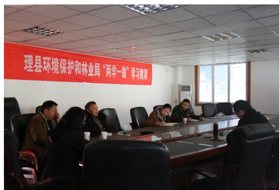
年末の会議の様子（ガンブ村）