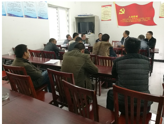
Xiaozhaizigou 自然保護区のプロジェクト開始会合

Xiaozhaizigou 自然保護区内の、アグロフォレストリープロジェクト開始の会合が、10 月 9 日に Wulong 村で開催されました。地域の代表と Xiaozhaizigou 自然保護区の管理者がプロジェクトに協力するという契約に署名しました。コミュニティは土地と労働力を提供し、苗木やその他必要なものは保護区が提供して、CI は実験サイトを成功させるための技術トレーニングを支援します。植付けの計画や関係するスケジュールやトレーニングなどについて、話し合いを続けています。