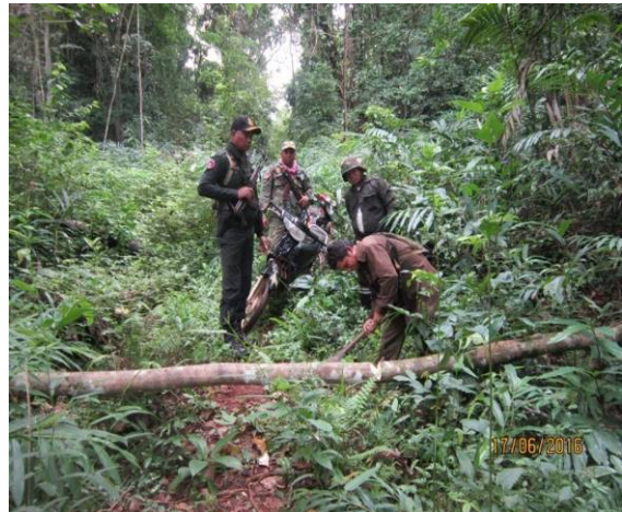
パトロールの様子と押収された木材