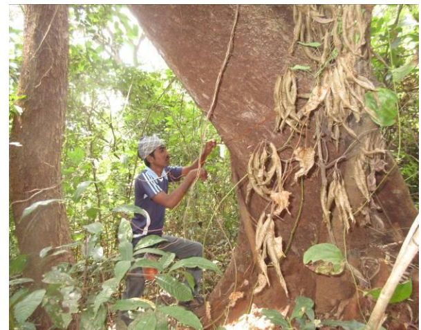
AERF の現地事務所でのトレーニング(左)、セイタカミロ balan へのタグ付け(右)