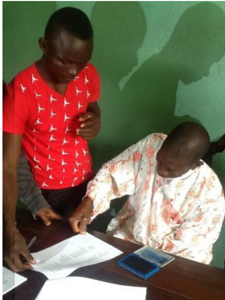
Yolowee 村長が保全契約に署名