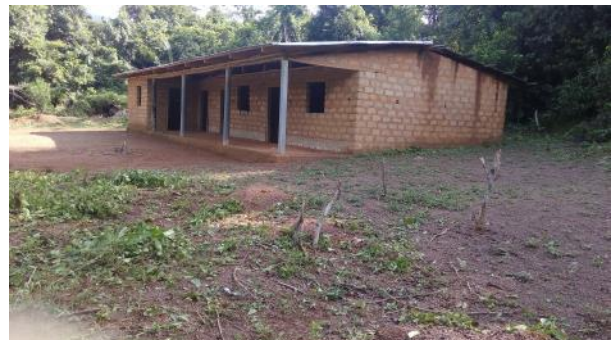
村で唯一の小学校

森は、様々な野生生物の生息地であると同時に、Yolowee の人々にとって、文化的・伝統的な習わしを執り行うための神聖な場所でもあります。森林は、また、食料を提供し、水を供給し、土壌を流出から守ります。森に生息する動物は、人々にとってのタンパク源であり、