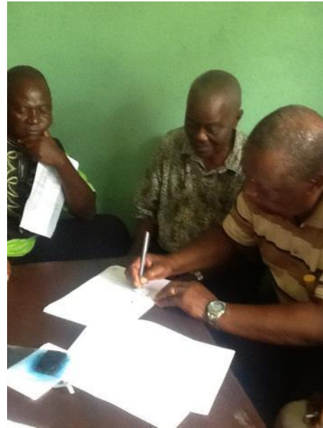
政府関係者が保全契約に署名