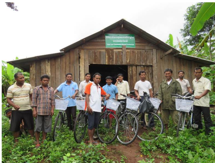
新しい自転車と、観光情報センターの前で