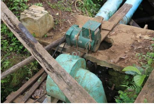
マイクロ水力発電ユニット