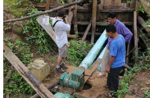
Tatoi Leu 村にて、マイクロ水力発電ユニットを調べる研究者