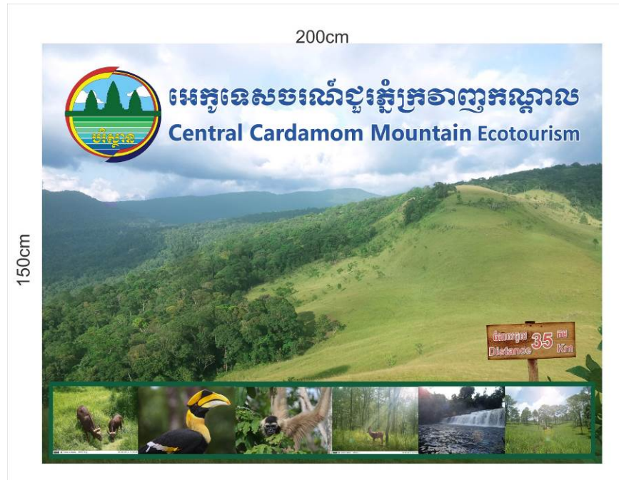
Tatai Leu 村のエコツーリズムの看板の例

Tatai Leu 村におけるエコツーリズムの開発はずいぶんすすみましたが、カンボジアではこの数ヶ月は雨季のため、観光客がほとんど訪れません。この期間を利用して、エコツーリズムを催行するコミュニティの体制の強化、レンタサイクル用の自転車の購入、インフラの改善をしました。ホームステイの施設や看板も完成しました。