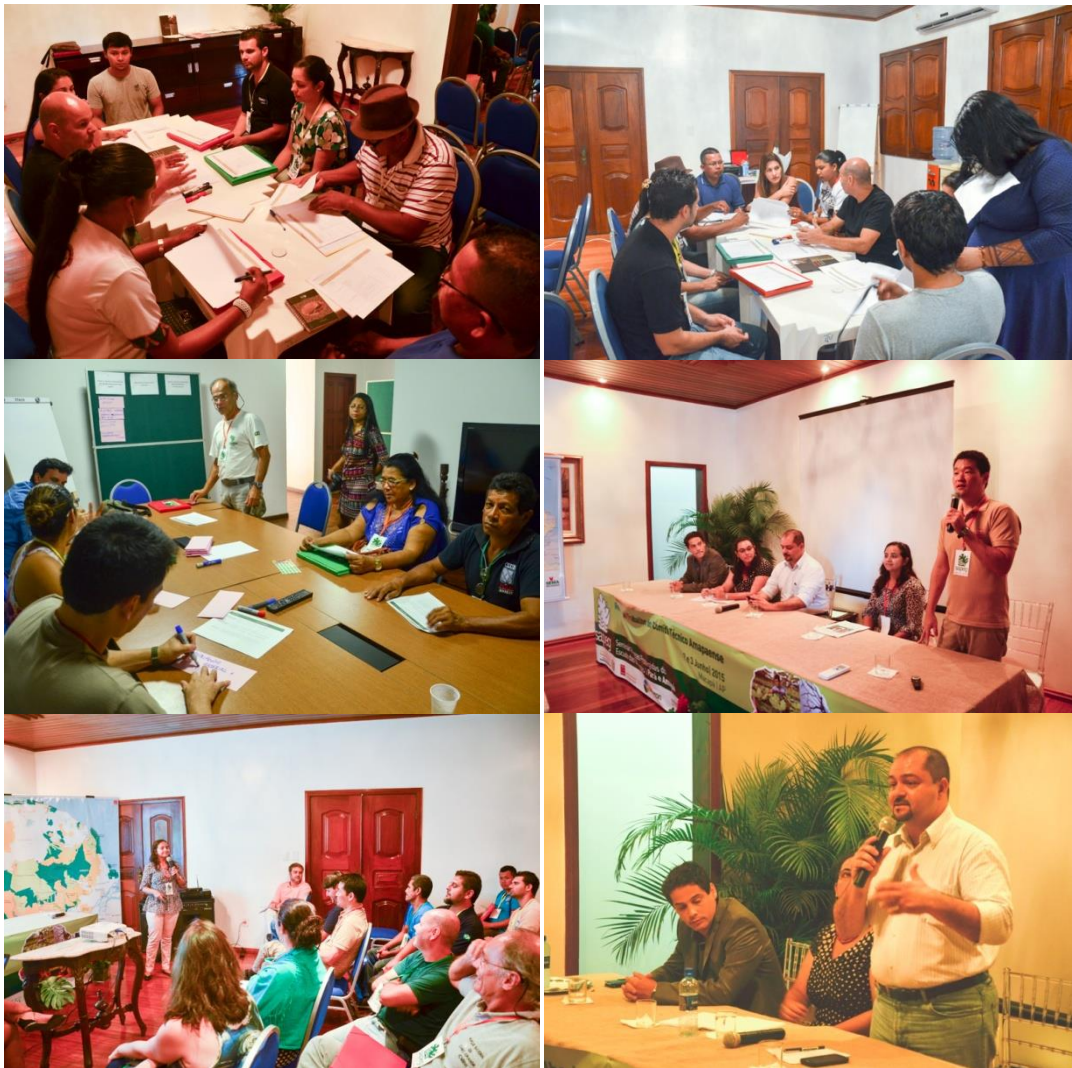
SAPEG での議論の様子

いくこと、伝統的な知識や文化の価値を明らかにしていくこと、持続可能な生産網を強化していくことなどです。