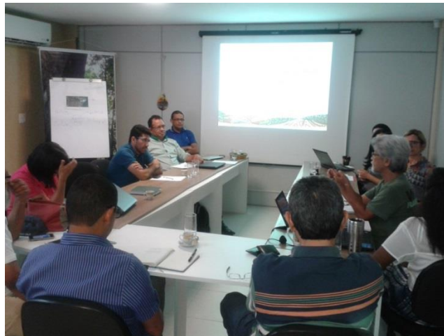
6月16日に開かれた会合の様子

6月16日に、ブラジルのパラ州のベレン市で、政府、市民社会、研究所などの代表が参加する会合が開かれ、森林管理を強化するための方法やネットワーク作りに向けた戦略について技術的な議論がされました。さらなる議論を行うために、8月に再度会合を開きます。