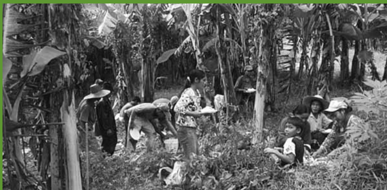
Membros da associação de agricultores locais plantando um piloto de 20 hectares, projeto Quirino, Filipinas.

das idéias deve incluir: i) atividades de fomento à capacitação, para que os agentes locais tenham a habilidade e a capacidade para participar das iniciativas florestais de carbono; ii) mecanismos claros para o fornecimento de informações regularmente atualizadas sobre políticas e atividades de REDD+ aos atores, além da troca de informações e dados entre os mesmos.