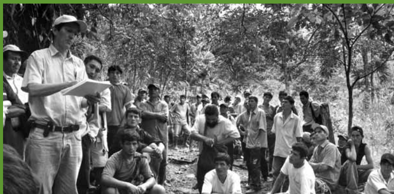
Reunião para o engajamento dos atores locais no projeto de Alto Mayo, Peru.

projetos florestais de carbono florestal são rigorosamente científicos, bem projetados e apoiados por forte especialização técnica também encoraja o investimento. Em alguns casos, o desenvolvimento de iniciativas piloto em pequena escala - tais como atividades de reflorestamento -, também tem atraído investidores ao mostrar como as atividades específicas irão funcionar na prática e que estas são viáveis e ainda geram experiência para implementação gradativa em maior escala. Algumas iniciativas também alavancaram mais financiamento por terem realizado estudos de viabilidade que podem ser usados para atrair doadores e investidores, ou por meio de parcerias com outras organizações que têm interesse em oferecer recursos para reflorestamento e atividades florestais de carbono. O desenvolvimento de projetos florestais de carbono em regiões que já contam com ações anteriores junto às comunidades locais, também ajuda a dar segurança aos doadores sobre o sucesso potencial das iniciativas e aumentaram o apoio obtido.