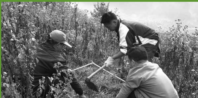
Amostragem da biomassa herbácea no projeto Tengchong, China.

créditos de carbono somente acontecerão após os créditos serem gerados e verificados, de tal forma que pode haver uma lacuna de vários anos entre o início das atividades de campo e a geração de receitas da venda de créditos de carbono. Essas questões precisam ser cuidadosamente consideradas no orçamento do projeto bem como na parte de gestão e captação de fundos.