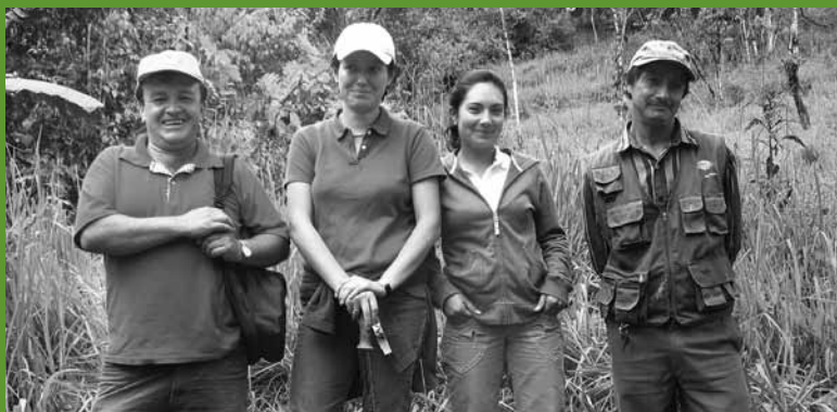
Equipe CI e parceiro local, Fundação Maquipucuna, durante a visita de campo ao projeto ChoCO 2 , Equador.

Concentramos nossa análise nos cinco pontos que avaliamos como mais críticos para o sucesso: 1) criação e consolidação de parcerias locais efetivas e capacitação para o tema de florestas e carbono; 2) garantia de que as iniciativas florestais de carbono sejam apoiadas por rigorosas análises técnicas e científicas; 3) captação dos recursos financeiros necessários ao desenvolvimento das iniciativas; 4) envolvimento dos diversos atores na estruturação do desenho e implementação dos projetos; e 5) garantia de apoio governamental ativo para as atividades de campo. Em cada caso apresentamos uma visão geral de