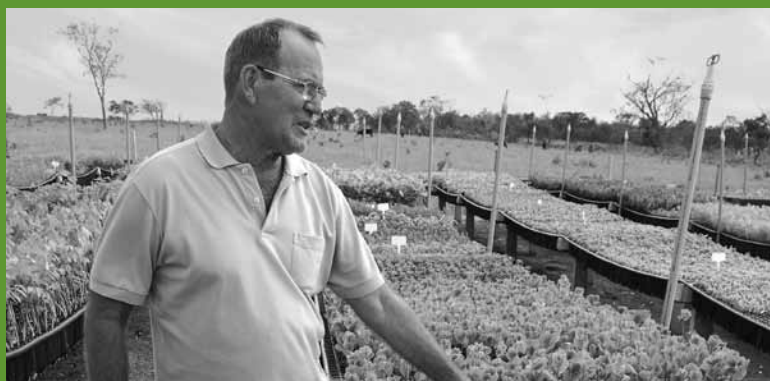
Gerente do viveiro do parceiro local, Oréades, explicando a seleção de mudas para o projeto de Emas, Brasil.

de autoridades governamentais nos processos de tomada de decisão, campanhas sobre estratégias de conscientização e disseminação de idéias. Se possível, obtenha o endosso oficial do governo para tais iniciativas.