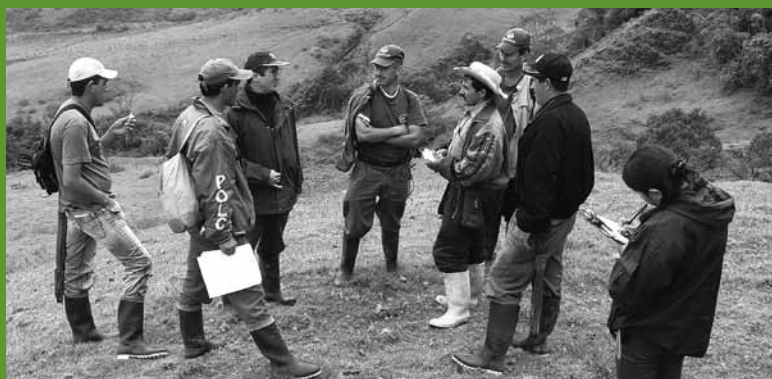
Engajamento de atores locais para a visita de campo à comunidade Junín no Corredor Bogotá, Colômbia.